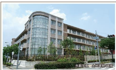
外観写真 土地建物/賃借