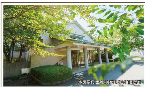
外観写真 土地/賃借 建物/自己所有