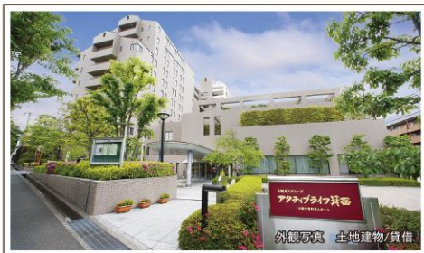
外観写真 土地建物/賃借